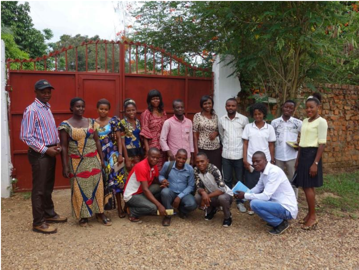
Abb.: Studieren ohne Grenzen e.V.

UNIVERSITÄT HEIDELBERG ZUKUNFT SEIT 1386